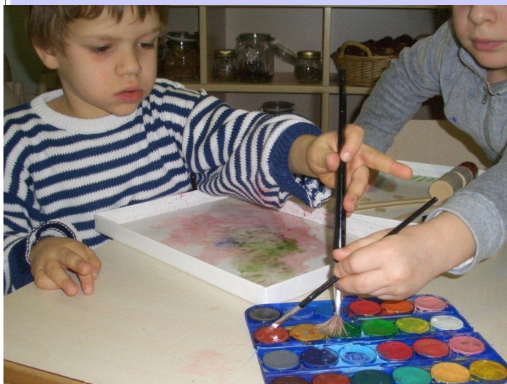
"Artisti insieme"

E' pertanto necessario prenotare la propria partecipazione con l'invito a comunicare tempestivamente l'eventuale impossibilità a partecipare, per dar modo ad altri di essere presenti.